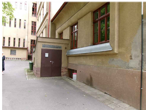
FOTO - STÁVAJÍCÍ STAV